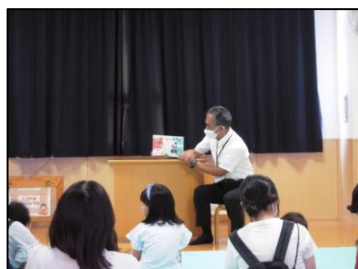
図書館の館長や男性職員によるおはなし会の様子です。ゆったりとした時間を過ごしていただきました。

7月21日から23日の期間で、岡崎図書館まつりを開催しました。日頃図書館を支えているボランティア団体の方々が中心となり、パネル展示、読み聞かせ、ワークショップなどを実施し、たくさんの来場者に楽しんでいただきました。図書館まつりがきっかけとなり、普段図書館を利用していない人が来館するきっかけになるとうれしいです。