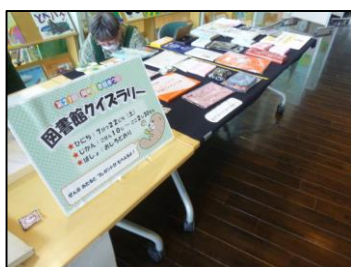
図書館内各所を巡るクイズラリー。全問正解者には雑誌の付録をプレゼントしました。