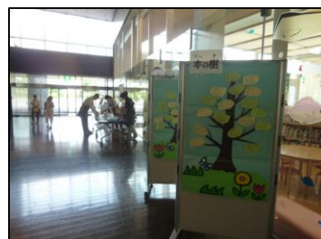
おすすめ本を葉っぱに書いて紹介する「本の樹」。たくさんのかたの協力で大きな樹になりました！