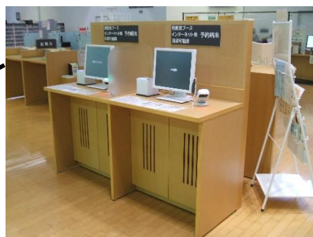
👉専用端末が2台増えました！