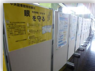
↑岡崎市民病院のスタッフが糖尿病とその合併症についての紹介パネルを作成しました。

市民病院と連携した特別展示は3回目ですが、多くの資料が貸出されたり、講座の定員もすぐに埋まるなど、利用者みなさんの関心が非常に高い分野であることを改めて実感しました。