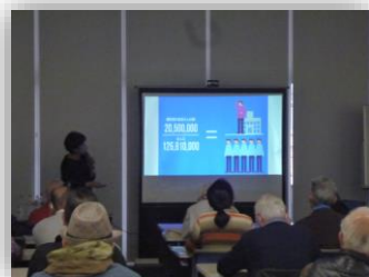
↑講座当日の様子。みなさん大変熱心に聴講されました。