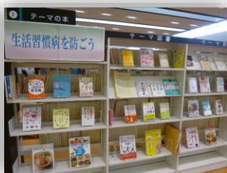
↑テーマ展示「生活習慣病を防ごう」の棚。レシピ本や体操に関する資料を集めました。