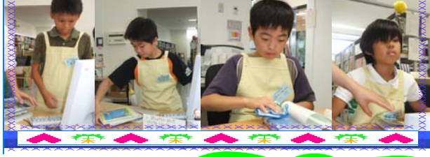
7がつ3にち・8がつ1にちに1日図書館司書体験が行われました。