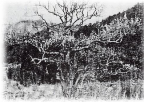
「続とっかわの里」より

幹周り4m、高さ12mに及ぶ推定樹齢300年の古木でしたが、昭和34年の伊勢湾台風で倒れて枯死。その後分岐枝を植栽したところ、幹周り1.5m高さ8mに成長しました。しかし、平成21年の台風18号で再び倒木。その後、樹木医による治療が施され、現在の姿になりました。