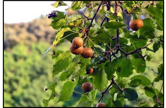
愛知県岡崎市公式観光サイト 水と緑の森の駅 より

鳥川町に自生している野生梨の一種、「とよとみ梨」。 世界でこの一本しかないそうです。 岡崎市の天然記念物に指定されています。 名前の由来は、鳥川町が豊富村だったことによります。